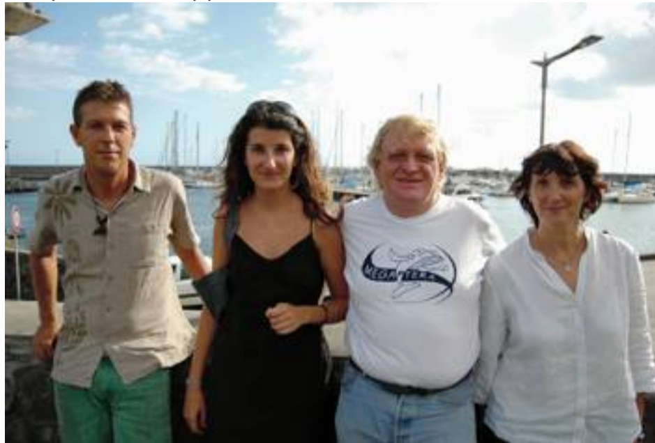
Megaptera s'est déjà associée avec l'association Abyss, créée depuis quatre mois. Au total, quatre associations se partagent le créneau des cétacés à La Réunion.

La touche Megaptera, c'est dix ans d'expérience dans l'écotourisme, avec différents sites, différentes approches. On a d'abord travaillé à Mayotte, aux Comores, à Madagascar, on est allé à Djibouti pour le requin-baleine, on a collaboré avec des associations aux Seychelles. Maintenant, on va travailler à Rodrigues sur un projet. Il y a aussi cette volonté d'accompagner l'écotourisme. Je pense que maintenant c'est un vrai débat et il y a un réel enjeu pour que l'écotourisme devienne équitable à La Réunion. Peut-être que d'autres associations ont plus envie de se focaliser sur les animaux, sur la recherche. Nous, l'interface avec l'homme nous